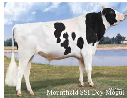
Mountfield SSI Dcy Mogul